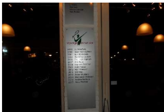
Alvast een impressie van de Vrijwilligersavond

Wij wensen u veel plezier met deze Bundel, prettige paasdagen en een sportief nieuw seizoen.